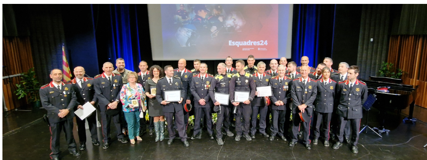
L'acte de celebració del Dia de les Esquadres va reunir més de 160 persones a l'Espai d'Arts Escèniques

Els Mossos d'Esquadra van fer un reconeixement a la Unitat Dron de la Policia Local.