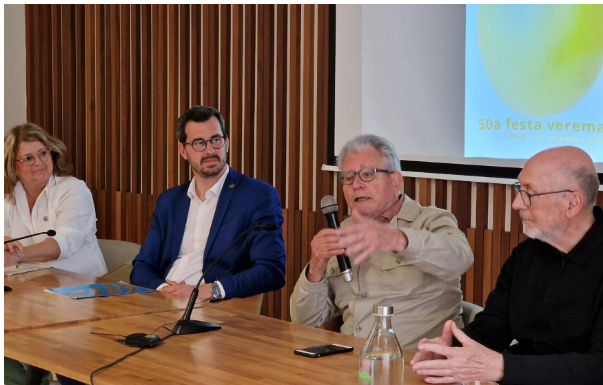
El 18 d'abril es va fer la presentació de la imatge de la 50a Festa de la Verema.

Ja fa molts mesos que l'Ajuntament treballa en els preparatius d'aquest im-