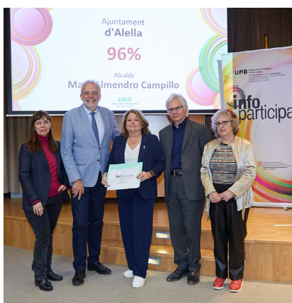
L'acte de lliurament es va fer el 9 d'abril.

Els 52 indicadors en què es basa l'avaluació dels webs han estat actualitzats en aquesta onzena edició: malgrat el nivell més alt d'exigència, els resultats